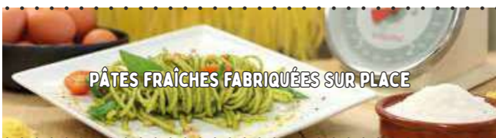
PÂTES FRAÎCHES FABRIQUÉES SUR PLACE

SAINT MARCELLIN 16,90 € Salade, tomates, oignons rouges, lardons et pancetta grillés, St Marcellin dans sa pâte filo, le tout frit